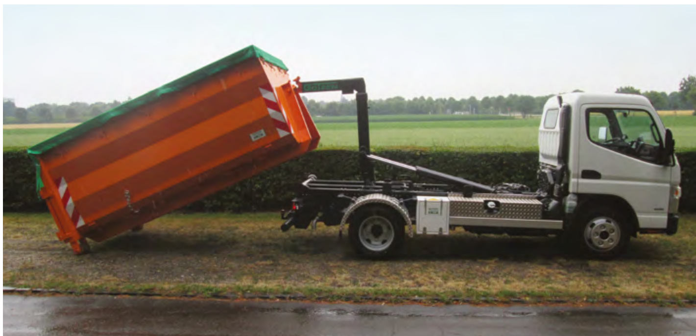
Vyložení kontejneru CITY-WDC