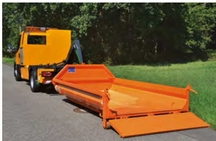
CITY-WDC s přejezdovou klapkou