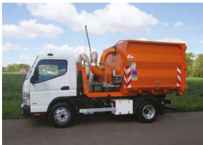
CITY-WDC s úpravou pro vysávání listí