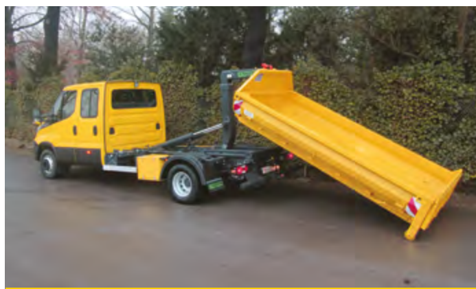
Manipulace s kontejnerem