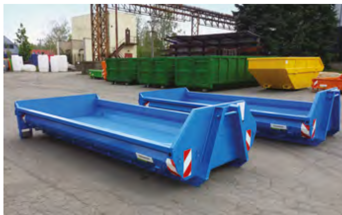
CITY-WDC s přejezdovou klapkou